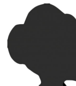
Clémence CLOS Sociologie des organisations