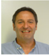
Alain LAURENT Monnaie et finance 2 Macroeconomics 1 Macroéconomie 2 Macroeconomics 2